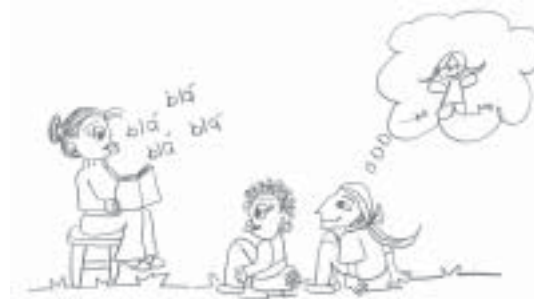
Ilustração - Natalia Silva Santiago

Quem nunca ouviu essa expressão? Quem nunca escutou uma historinha na escola, ou na casa da avó, ou na hora de dormir? Provavelmente você já passou noites em claro com medo de fantasmas, bruxas e lobos maus. Já torceu por princesas e seus príncipes encantados, perdeu o fôlego em batalhas e respirou aliviado com os finais felizes para sempre.