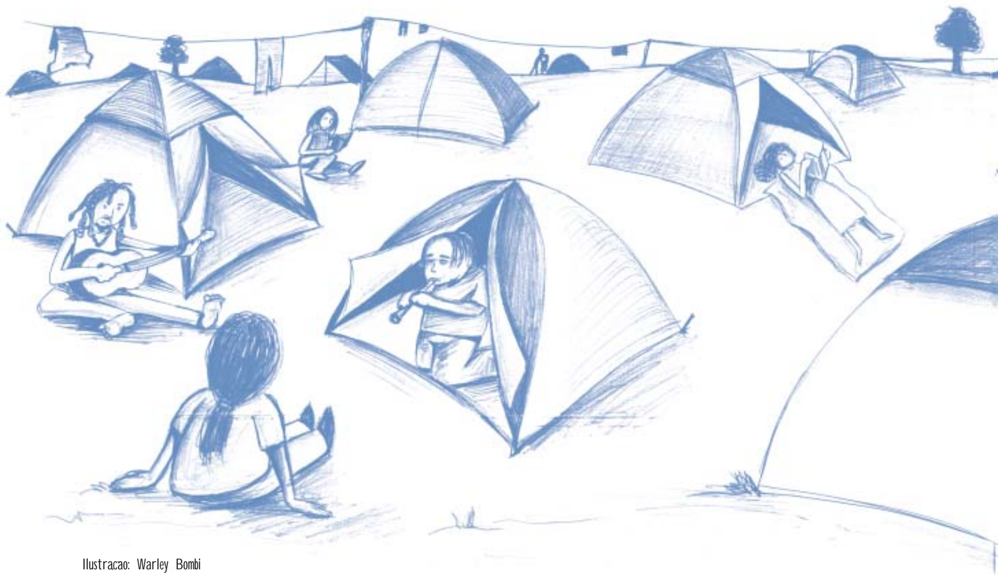
Ilustração: Warley Bombi

Para alguns, a hora do banho era o momento mais legal. Para outros, um pesadelo. Os chuveiros eram