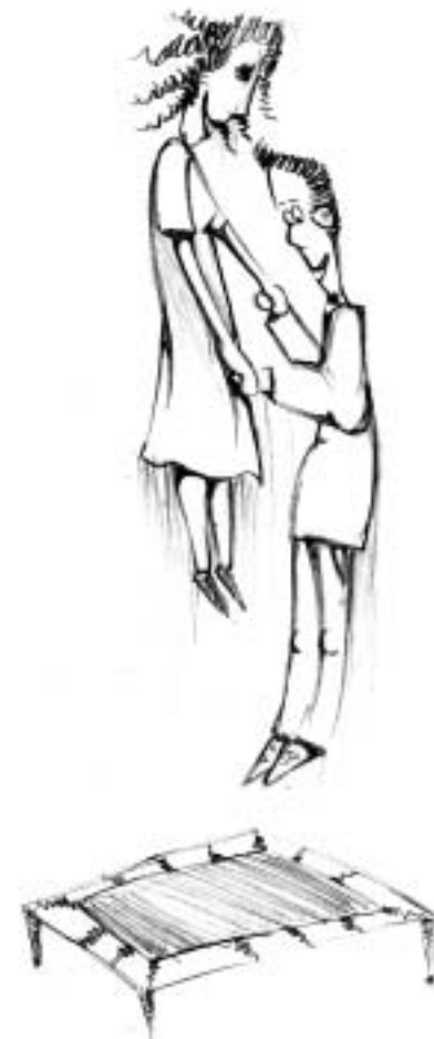
Ilustração: Warley Bombi